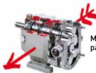
Med pumpe på rette staden

Froster AS er et industrirelatert, 100% norskeid, ingeniør og salgssfirma med kompetanse og kvalitetsprodukter for både on- og off-shore industri. Hovedproduktet er prosesspumper for industrien.